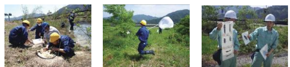
水生生物調査 チョウの捕獲調査 生徒自身による解説