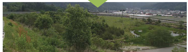
H25 年からドブシジミ (現在：平成 26 年)