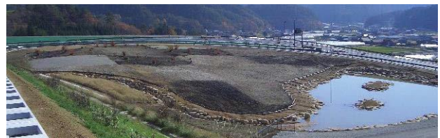
(施工当時：平成 16 年)