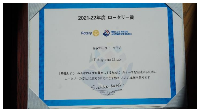
【2021～2022 年度 RI 表彰】 ロータリー賞を受賞しました。